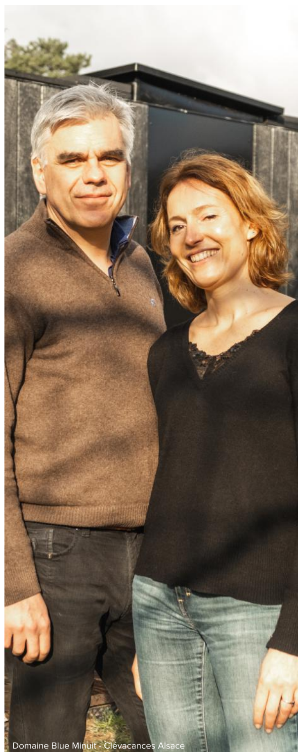
Domaine Blue Minuit - Clévacances Alsace

Nous apprécions notamment les valeurs partagées : la qualité d'accueil et la promotion du terroir. "