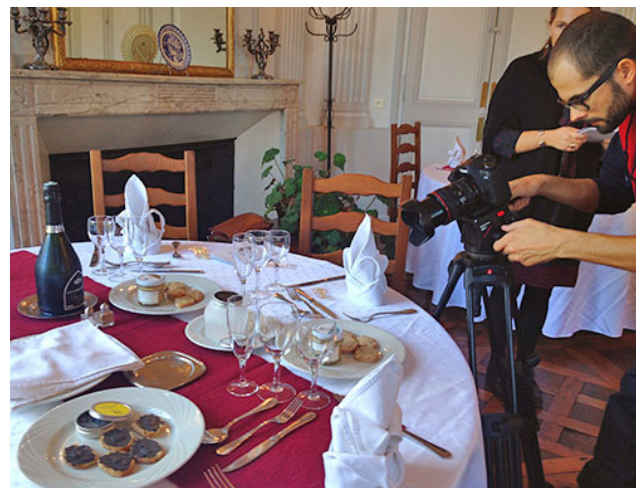
Accueil presse TV - RAI Italie - octobre 2015

France 3 : les Carnets de Julie (Thème : la truffe), France 2 : Météo à la carte (Excideuil, vallées Vézère et Dordogne), RAI Italie (Thème : la gastronomie), TV5 Monde (Epicierie fine et Terroirs Gourmands), TV Malaisienne Astro Broadcasting (Emission 360° Vallée de la Dordogne).