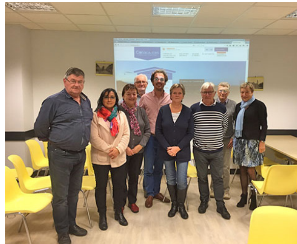
Les propriétaires Clévacances en formation

C'est ainsi que notre département de la Dordogne assure désormais l'animation de la Corrèze et du Lot, ce qui a permis de mieux accompagner les propriétaires en mutualisant de nouveaux moyens (formation, référencement, web, promotion...).