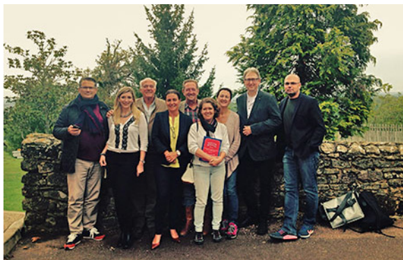
Accueil presse autrichienne - septembre 2015

The Sunday Times (GB), French Entrée (GB), Bradford Telegraph and Argus (GB), Living Magazine, Yorkshire (GB), France Magazine (GB), Kronenzeitung, Kleine Zeitung, Kurier Reise, Oberösterreich Nachrichten, TIP, Der Standard, Salzburger Nachrichten, Europe Airspost (Autriche), Life Magazine (Belgique), Blog "Cheeseweb-slow travel" (Belgique), Blog Voyage Planeta Dunia (Esp), Blog Voyage "Volandovoyviajes" (Esp), Blog "Familiasenrutas" (Esp), Brigitte Woman (Allemagne), Voyage presse Atout France (NL), Le Journal de Montréal, Doctor's review (Canada).